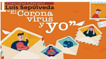
DIBUJOS, CARTAS Y/O VIDEOS PODRÁN PARTICIPAR.

anuar esfuerzos interdisciplinarios para hacer frente a esta pandemia; “Nos parece muy importante, en primer lugar, que los ministerios de las Culturas y Ciencia realicen acciones conjuntas, porque pienso que tenemos muchos puntos en común para trabajar en el desarrollo integral de un país. Y en este caso particular, de la emergencia sanitaria, trabajamos en la sanación de las personas, tanto física, como espiritual, de una manera integral, que es donde el arte